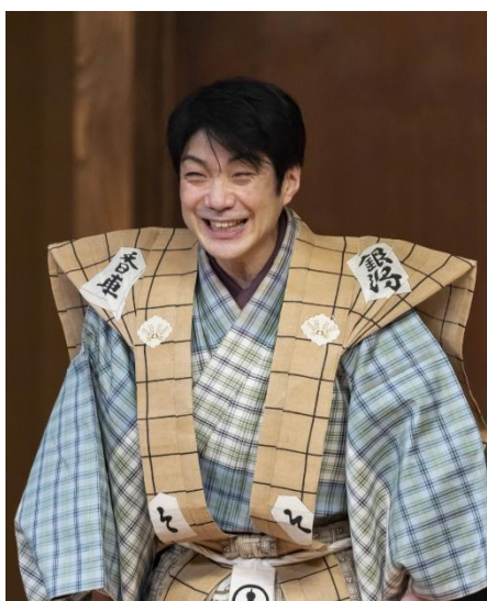
音声解説 野村萬斎

NTT ソノリティ株式会社（本社：東京都新宿区、代表取締役社長：坂井 博、以下「NTT ソノリティ」）は、2025 年 4 月 26 日（土）に大阪フェスティバルホールで開催される「祝祭大狂言会 2025」の演目『MANSAI ボレロ』において、NTT 独自の音響 XR 技術と PSZ（パーソナライズドサウンドゾーン）技術を搭載した「nwm（ヌーム）」のオープンイヤー型有線耳スピーカー「nwm WIRED」を活用した音響演出、野村萬斎氏による「スペシャル音声ガイド」の実施が決定したことをお知らせいたします。これを記念して、nwm 公式 X アカウントでは「祝祭大狂言会 2025」スペシャル音声ガイド付き鑑賞席が当たるキャンペーンを実施します。