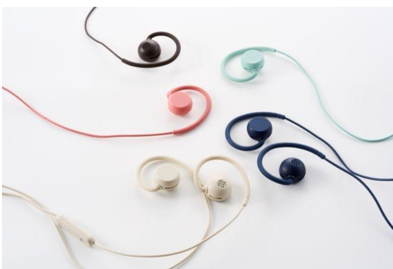
nwm WIRED (3.5mm)